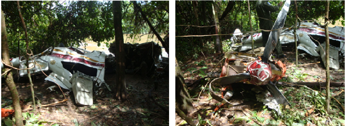
Figuras n 04 e 05: Destroços da aeronave e da hélice.

Em função da grande energia do impacto da aeronave contra o rio, a aeronave ficou completamente destruída. As deformações encontradas na hélice evidenciaram que o motor estava em funcionamento no momento do impacto contra o solo.