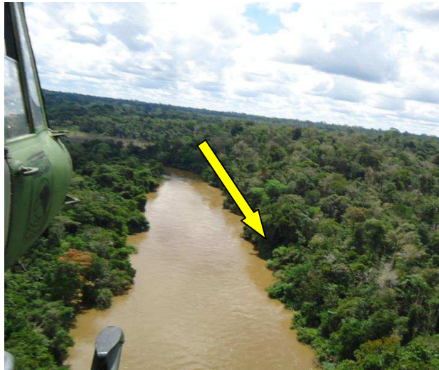
Figura 03: Local onde a aeronave e os ocupantes foram encontrados.

As buscas foram finalizadas em 18MAIO2011, quando um morador da região encontrou os destroços da aeronave ao mergulhar no rio.